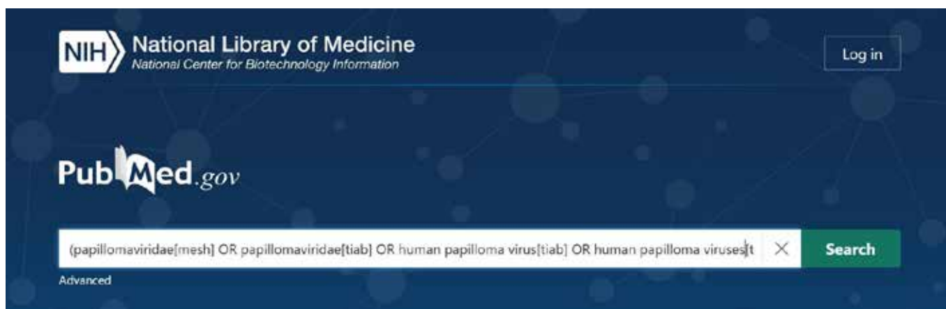
Slika 2: Iskalni izraz v iskalniku PubMed