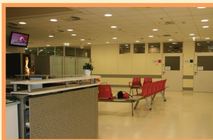
Recepcija Oddelka za teleradioterapijo