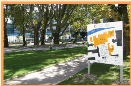
Park pred stavbami Onkološkega inštituta