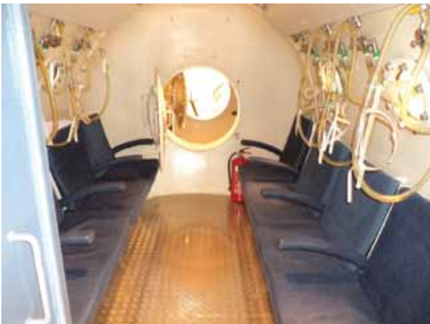
Slika 3: Hiperbarična komora na Medicinski fakulteti v Ljubljani

Redkejši zaplet je barotravma obnosnih sinusov in/ali pljuč, ki nastopi ob nezdravljenem pnevmotoraksu, zelo redko pa pride do barotravme zob ali očesa, ki nastane zaradi ujetega zraka po posegu.