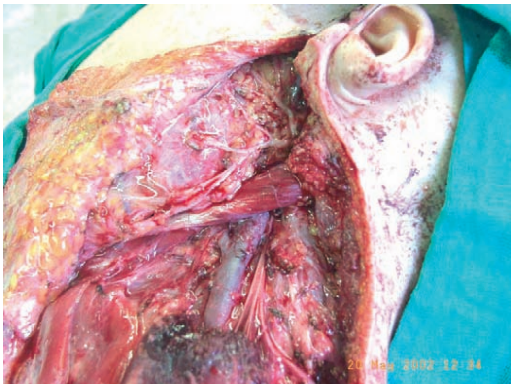
Slika 3. Radikalna limfadenektomija na vratu.

primarni melanom ali ob brazgotino po diagnostični eksciziji. Mesta bezgavk na limfoscintigrafiji markiramo na kožo. Tik pred operacijo na ista mesta, kamor smo injicirali Tc^{99m} nanokoloid, injiciramo še Patent Blue modrilo. To nam omogoči, da so drenažne bezgavke tudi modro obarvane. Varovalno bezgavko ločimo od ostalih bezgavk in maščevja s pomočjo posebne sonde, ki zaznava radioaktivnost in s pomočjo modre obarvanosti (Slika 2). Incizija pri biopsiji varovalne bezgavke mora biti vedno tako orientirana, da nebi motila morebitne kasnejše terapevtske disekcije, ki bi bila potrebna v primeru zasevkov v varovalni bezgavki.