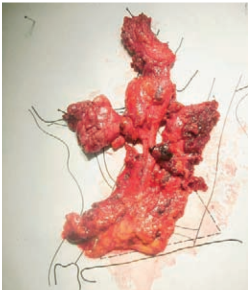
Slika 4. V bloku odstranjeno limfatično tkivo vratu.

todo uporabljamo le v specializiranih institucijah.