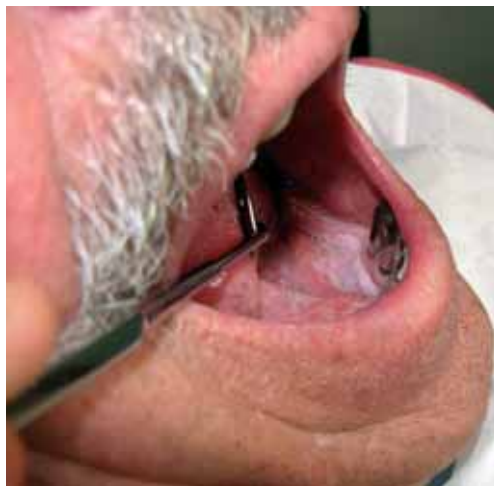
Slika 2. Levkoplakija ustnega dna.

Primarni tumorji v ustni votlini tako lahko vzniknejo iz površinskega epitelija, iz malih žlez slinavk, iz submukoznih mehkih tkiv, iz dentalnega aparata, iz kosti ter iz nevrovaskularnih tkiv. V področju glave in vratu se epiteljski tumorji najpogosteje pojavljajo prav v ustni votlini. Med malignimi tumorji najdemo v več kot 90% sluznični ploščatocelični karcinom, ki je največkrat povezan s čezmernim uživanjem tobaka in alkohola. Z alkoholom in tobakom povezan ploščatocelični karcinom zgornjega aerodigestivne-