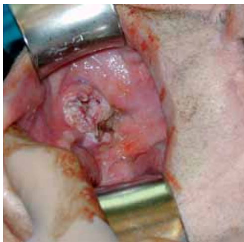
Slika 4. Napredoval karcinom v predelu retromolarnega trigonuma. Klinično in patohistološko T4 N2bM0 karcinom.

Tudi levkoplakija se podobno kot ploščatocelični karcinom pojavlja dvakrat pogosteje pri moških in verjetnost, da bo prišlo do maligne preobrazbe, je pri moških večja. Levkoplakija je najpogostejša kronična sprememba v ustni votlini, ki v našem geografskem prostoru prizadene okrog 3% populacije. Levkoplakije v ustih se lahko s časom spreminjajo. Posebnost levkoplakij je v tem, da dolgotrajna prisotnost levkoplakičnih sprememb ne kaže na neškodljivo naravo sprememb, ampak se s trajanjem levkoplakičnih sprememb večja verjetnost maligne preobrazbe. Starejša kot je levkoplakija, slabša je njena prognoza.