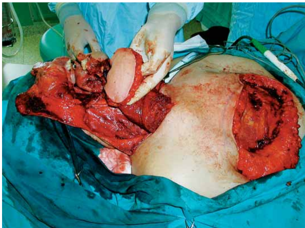
Slika 6. Rekonstrukcija po obsežni operaciji napredovalega karcinoma v predelu retromolarnega trignonuma. Rekonstrukcija je napravljena s pektoralnim kožnomišičnim režnjem.

in bolečin. Tumorji v zgodnji fazi se največkrat kažejo kot rdečkasta ali belkasta sprememba na sluznici, kot razjeda, ki traja več tednov ali mesecev, se ne zaceli in večkrat zakrvavi. V začetku ti tumorji ne bolijo, v napredovali fazi pa je bolečina navadno precej izražena 5 . Žal se še vedno večina rakov v ustni votlini odkrije šele v napredovali fazi in, kot omenjeno, bolniki redko poiščejo pomoč zdravnika ali zobozdravnika zaradi asimptomatskih sprememb v ustni votlini.