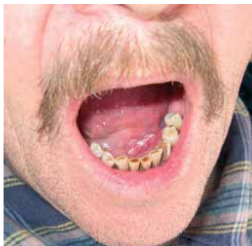
Slika 3. Začetni ploščatocelični karcinom ustnega dna.

sprememb se redko preobrazijo v raka, verjetnost maligne preobrazbe je okrog 5%. Levkoplakije, ki vzniknejo na več mestih, nehomogene levkoplakije in levkoplakije, ki povzročajo simptome (običajno pekoče bolečine) in trajajo dolgo, imajo večjo verjetnost, da se preobrazijo v raka (Slika 3).