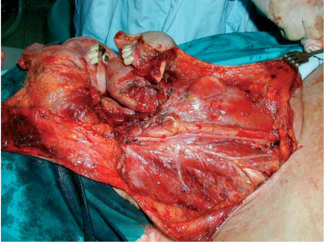
Slika 5. Operativno zdravljenje napredovelega karcinoma v predelu retromolarnega trigonuma. Napravljena je bila razširjena radikalna disekcija vratu in ekscizija tumorja s segmentno mandibulektomijo, delno glosektomijo in delno ekscizijo mehkega neba in tuberja maksile.

levkoplakijami (običajno 2–3) ima po naših izkušnjah 60% pacientov ustno sluznico brez sumljivih sprememb, 30% pacientov ima na sluznici spremembe, ki pa niso tako izražene, da bi se spet odločili za zdravljenje, pri okrog 10% pacientov levkoplakične spremembe vztrajajo in pri teh običajno pride do maligne preobrazbe 4 .