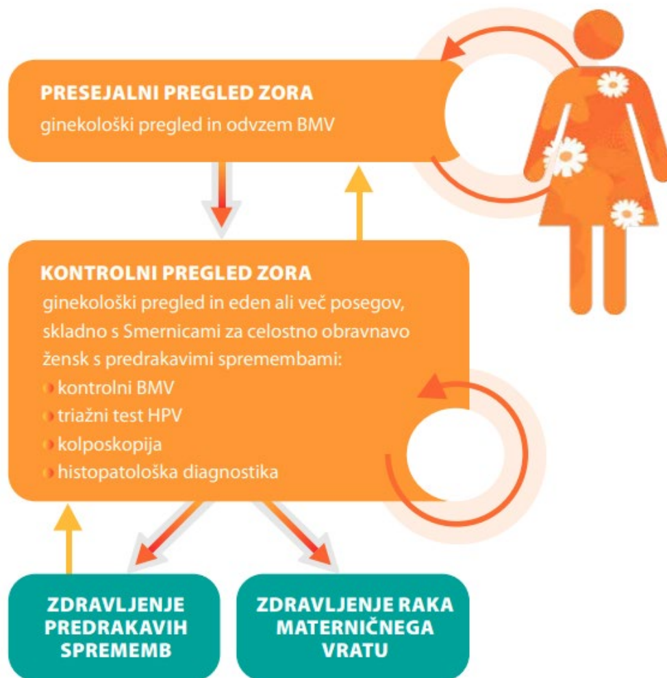
Slika 3. Pot ženske skozi program ZORA

V skladu s strokovnimi smernicami ginekolog pri ženskah s patološkimi spremembami nizke stopnje ali po zdravljenju predrakavih sprememb (pri točno določenih indikacijah) opravi tudi triažni test HPV . Negativen rezultat triažnega testa pomeni manjše tveganje za razvoj raka materničnega vratu. Pot ženske skozi program ZORA je prikazana na sliki 3.